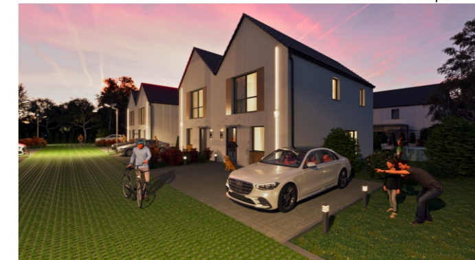
Widok od przodu