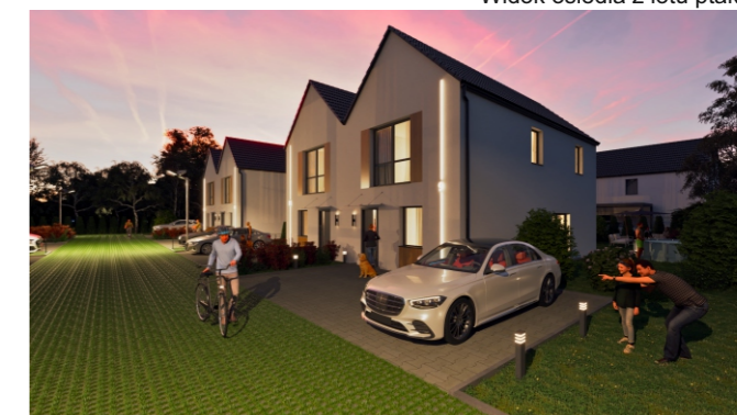
Widok od przodu